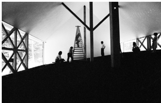
写真 多木浩二 | 文章 多木浩二, 今福龍太 | 編 飯沼珠実 | デザイン 高室湧人

A4変型 303x207mm | 256頁 | 写真125点収録 | デュアルトーン(スミ+シルバー) | 背開きコデックス装