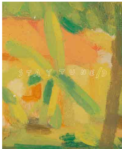
256×210×9mm 120ページ 並製 カバー付

「非情のジャングル フィリピン戦線生き残り元日本兵」より、「パン搬入作戦」抄録(日)