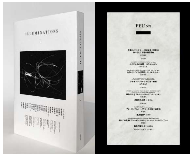
装丁／本文デザイン 栗原弓弦 (左：イルミネーション[創刊号])

前回好評いただいたヴヴェヂェンスキイやアルトー「イヴリーの手帖」抄訳に加え、アルトーも評価したジャン＝ピエール・デュプレールの詩や戯曲、ルー・リードに影響を与えたデルモア・シュワルツの詩、プラハ・アヴァンギャルドの作家パウル・レツピンの短編小説など、よりマイナーな海外文学作品も収録。