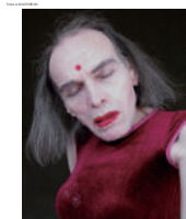
Portrait of a woman with a red bindi on her forehead.

本書は、千代田区とアーツ千代田 3331が主催する、世界22ヶ国（北南米、アフリカ、ヨーロッパ、アジア、オセアニア）の作家50名によるポコラート世界展「偶然と、必然と、」展の図録。図録では、独自のリサーチ、キュレーションの元に行われた展覧会の240点余の創作物が、展覧会の6つのテーマに沿って図版全212ページで掲載される。6つのテーマは、自己の内面、物と行為の関係、身近な事象や物のかたちの捉え方、環境から創作への影響、世界の成り立ちについての考え方、過去の記憶など。自身を被写体として様々な人物に扮し撮影したポートレートや世界の成り立ちをカレンダーで表現した創作など、国籍、年齢や性別、障害の有無、美術の枠組みさえも飛び越える創作の数々を本書でぜひご堪能ください。本邦初公開となる作品が数多く収録され、貴重な資料となること間違いなし。