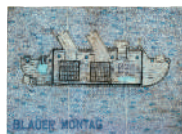
Abstract artwork titled 'BLADES MONTAG'.