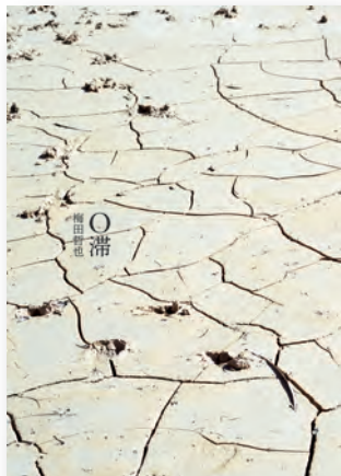
ビニールカバーあり (OPP袋に挿入)