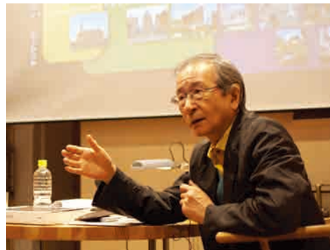
高宮真介 連続講義の様子

日本建築学会賞を受賞した資生堂アートハウスや葛西臨海水族園の設計者として知られ、長年谷口吉生氏のパートナーとして日本建築界を牽引してきた建築家 高宮真介。日本大学教授時代に行っていた伝説の授業「デザイン論」を再構成し、Archishop Library&Caféにて2013年より一年間12回にわたって開催された「ALC LECTURE Series vol.1高宮真介連続講義—ヨーロッパ近代建築史を通して、改めてこれからのデザインを探る—」の講義録が一冊の本にまとまりました。本書ではルネサンス以降現代までの西洋建築史を時系列でとりあげ、建築家として最前線に立ち続けている著者が選ぶ100人の作家・作品論が展開されます。これから学びはじめる学生の方から建築設計実務に携わる方々まで広く読んで頂ける一冊です。