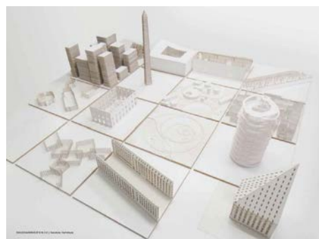
上：「東京のトポグラフィーと自生的秩序」日笠直彦 下：「HAUSSMANNISATION 2.0」吉村靖孝