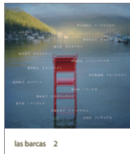
las barcas 2 (2012年12月発行)

崎浜 慎、徳田 匡、白木 游、酒井 直樹、 吉田 裕、根間 智子、井上 間従文、 奥間 勝也、岡田 有美子、川口 隆夫、濱 治佳、 吉増 剛造、山城 知佳子、砂川 敦志、 仲宗根 香織、新城 郁夫、山城 知佳子