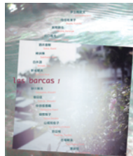
las barcas 1 (2011年7月発行) Sold out

■『パラダイスビュー』や『ウンタマギルー』を生み出した奇才映画監督・高嶺剛の新作『変魚路』(2015年公開予定)の一部分を誌面に公開!