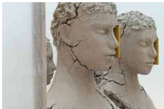
B5判変形 (255×180mm) / ソフトカバー / 216ページ デザイン: 須山悠里 / 撮影: 今井智己 テキスト: 松井みどり (美術評論家)、 ダグラス・フォークル (キュレーター)、 鎮西芳美 (東京都現代美術館学芸員) 言語: 日英 / 本体3500円(税別)

6月22日まで東京都現代美術館で開催され好評を博した、個展「マーク・マンダースの不在」にあわせ刊行された本書。本邦初公開や代表作を含む展示風景の全貌を今井智己が撮影した前半と、展覧会未出品を含む26点の作品について本人の自作解説、論考などを収録した後半部により構成されています。多様的に見えるマンダース作品の意味や魅力を、作家自身の言葉で読める唯一にして貴重な1冊となりました。