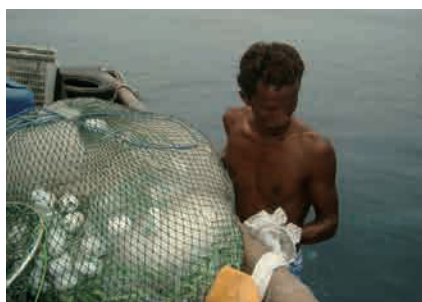
Survival Net Project