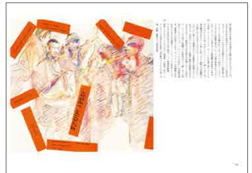
扉絵: 横尾忠則による、イッセイ ミヤケ パリ・コレクション招待状(1977~1998年)

三宅 一生 デザイナー ■1938年広島生まれ。多摩美術大学卒業。1970年、三宅デザイン事務所設立。1973年からパリ・コレクションに参加。衣服デザイナーとして、活動の当初から“一枚の布”を基本理念に据えて身体と布の関係を問い、創作活動を続けてきた。既成の枠にとらわれない自由な発想を、ねばり強いリサーチと実験のプロセスを経て現実化するものづくりの姿勢は、現在に至るまで一貫している。