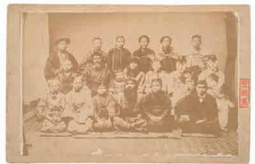
▲「学術人類館」で撮影された写真のうちの1枚。